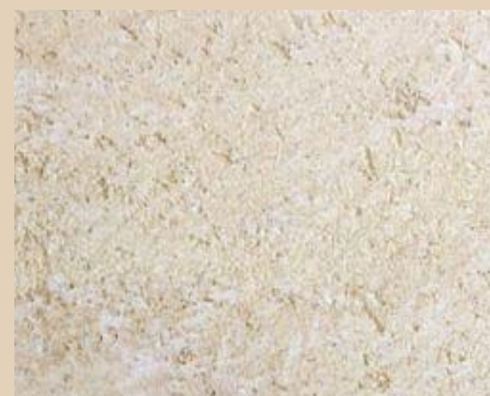
Apneni omet – fini – s stensko lazuro