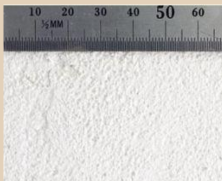
Apneni omet z izboljšanim oprijemom – nanešen z zidarsko žlico za glajenje

Vsebuje kalcijev hidroksid. Draži kožo. Obstaja nevarnost resnih poškodb oči. Poskrbimo za to, da material ne pride v stik s kožo in očmi. Če pride v stik s kožo, izperemo z vodo. Če pride v stik z očmi, oko takoj temeljito izperemo pod tekočo vodo in se posvetujemo z zdravnikom. Uporabimo zaščitna očala/zaščitne rokavice. Shranjujemo na mestu, ki ni dosegljivo otrokom. Bodite pozorni na možne alergije na naravne snovi.